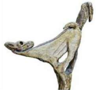
Propulseur au faon

Le silex éclaté ne suffisait donc plus Que la pierre polie devenait ton élue ? L'idée t'est donc venue d'un travail accompli Et mieux qu'être cassé le fallait-il poli ? Ton esprit d'homme neuf, peut-être un peu bravache, La fixa sur du bois pour en faire une hache ! Réussir cet outil fait de pierre et de corde A planté le respect dans les yeux de la horde ! De ce lointain passé, et sans trop d'indulgence, Il me semble entrevoir ta belle intelligence !