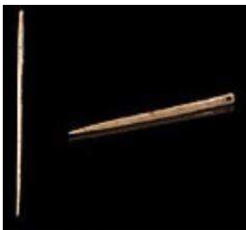
Aiguilles en os.

Avec armes et outils et tes fameux dessins On découvrit ainsi ce que fut ton destin Qui, de grottes en bivouacs, souvent la peur au ventre, A fait te réfugier dans n'importe quel antre ! Et, bien que certains nient ta vie dans les cavernes Au nom d'un pauvre dieu empreint de balivernes, Le contour de tes mains, les chevaux sur les murs, Qu'on découvre ébahi par un talent si sûr, Ont fini par prouver, quoiqu'il puisse en paraître, Que tu es à jamais notre lointain ancêtre !