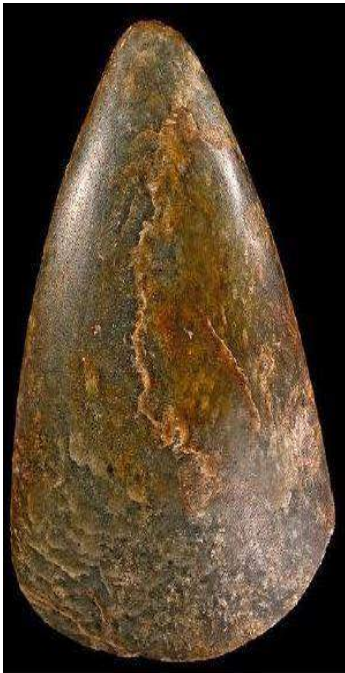
Hache en néphrite.

Le silex éclaté ne suffisait donc plus Que la pierre polie devenait ton élue ? L'idée t'est donc venue d'un travail accompli Et mieux qu'être cassé le fallait-il poli ? Ton esprit d'homme neuf, peut-être un peu bravache, La fixa sur du bois pour en faire une hache ! Réussir cet outil fait de pierre et de corde A planté le respect dans les yeux de la horde ! De ce lointain passé, et sans trop d'indulgence, Il me semble entrevoir ta belle intelligence !