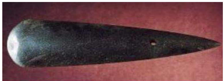
Hache en jadéite.

Du propulseur au faon à la hache polie, Des grattoirs anguleux, aux aiguilles jolies Tu as tout inventé en ces nuits ancestrales Près de ce feu dompté de façon magistrale. Quand on a pu souvent explorer ton décor, Tes outils retrouvés nous étonnaient encor Nous dévoilant un peu, comme une porte ouverte, La création humaine si pleinement offerte ! Ce que tu as légué, Ô vivant d'un autre âge, Nous devons le garder en précieux héritage !