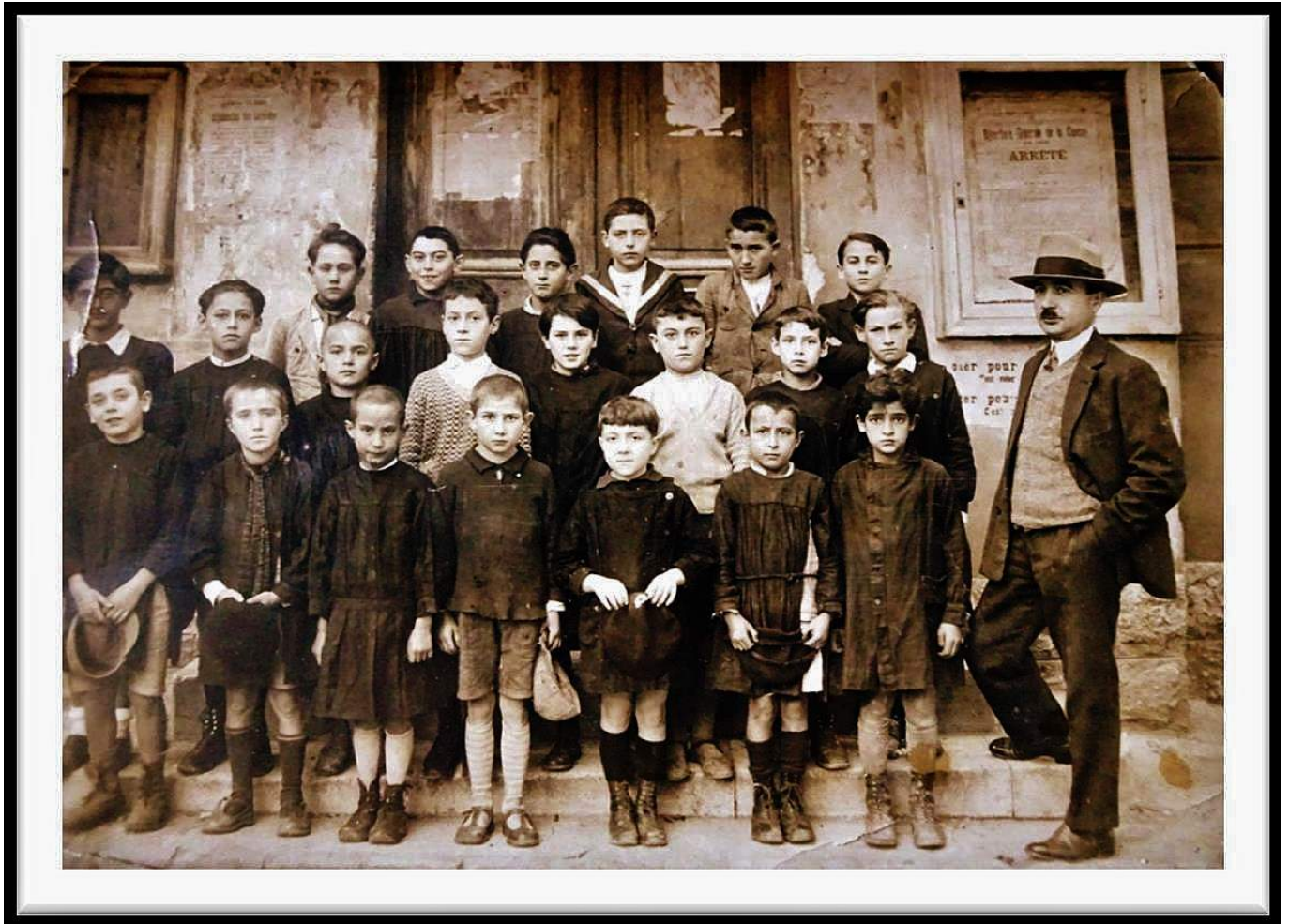
Classe Freinet le Bar-sur-Loup 1927-1928

Exposition FREINET à la fête de l'oranger au Bar-sur-Loup